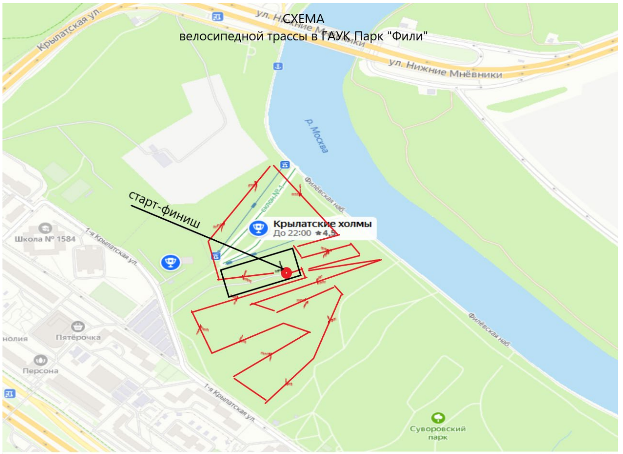
СХЕМА велосипедной трассы в ГАУК Парк "Фили"